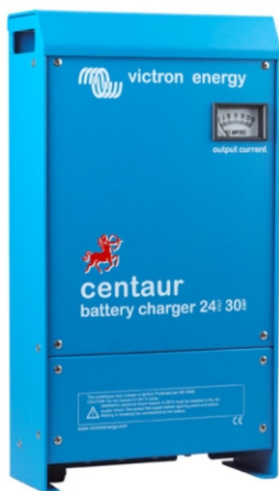
Centaur Battery Charger 24/30

Aby dowiedzieć się więcej na temat baterii i ich ładowania (także o zaletach i wadach ładowania wielu banków baterii, czy też inteligentnego ładowania), prosimy zapoznać się z naszą książką "Elektryka na pokładzie" dostępna bezpłatnie od Victron Energy lub w pliku od ściągnięcia na www.victronenergy.com